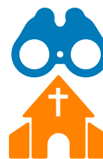
Paso 3 Investigue la "fuerza de la cosecha"