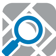
Paso 4 Investigue el campo de la cosecha