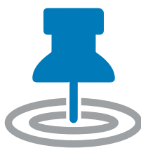
Paso 2 Identifique el objetivo