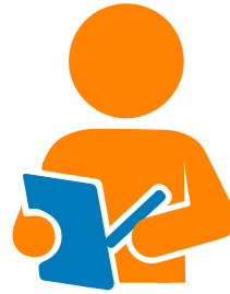
Encuestas y Cuestionarios