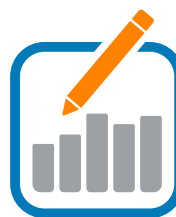
Paso 5 Analice los datos