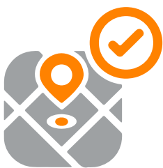
Paso 1 Defina el área

Hasta aquí hemos descrito tres asuntos clave sobre la investigación: qué es, por qué hacerla y cómo hacerla. Lo que presentaremos a continuación es un paso a paso de lo que debemos llevar a cabo en una investigación para la Plantación de Iglesias Comunitarias (PIC). La idea es que sirva como una guía para el trabajo que cada uno deberá realizar.